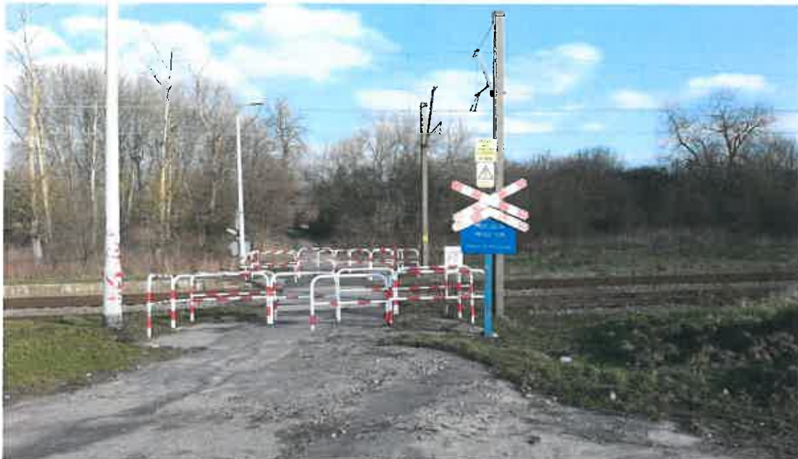
Fot. 1. Zagrodzony przejazd przez tory kolejowe przecinające ulicę Zagajnikową.