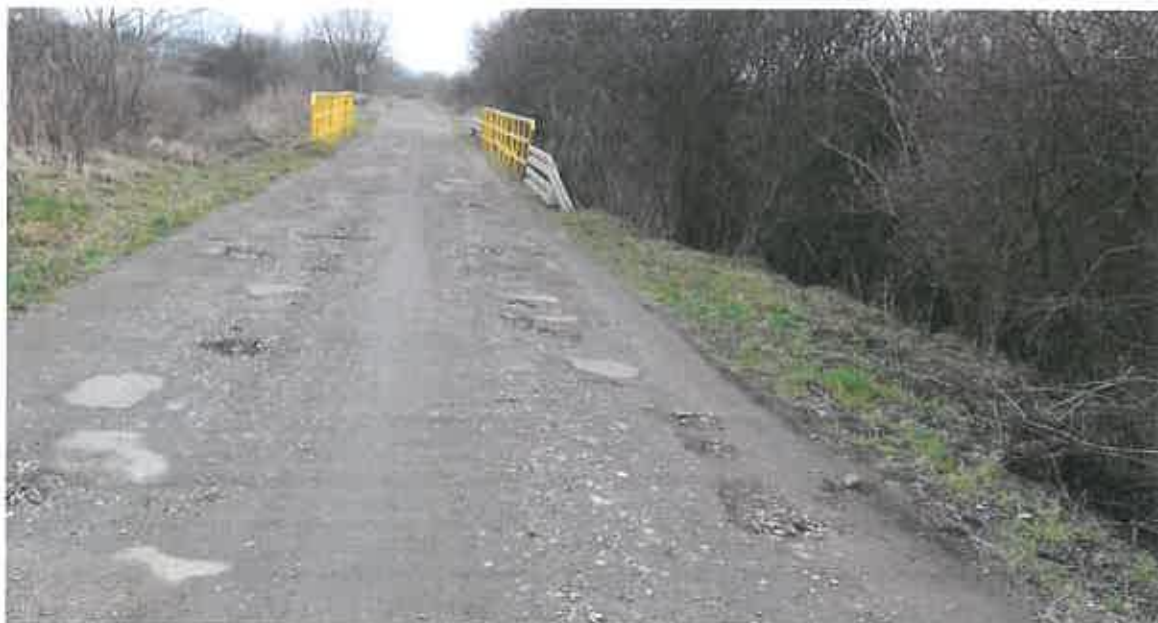
Fot. 3. Ubytki w nawierzchni ulicy Tęczowej.