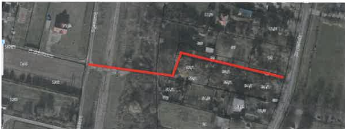
Fot. 2. Ulica Zagajnikowa - pierwotny dojazd od ulicy Krężnickiej ( http://geoportal2.lublin.eu/ ).