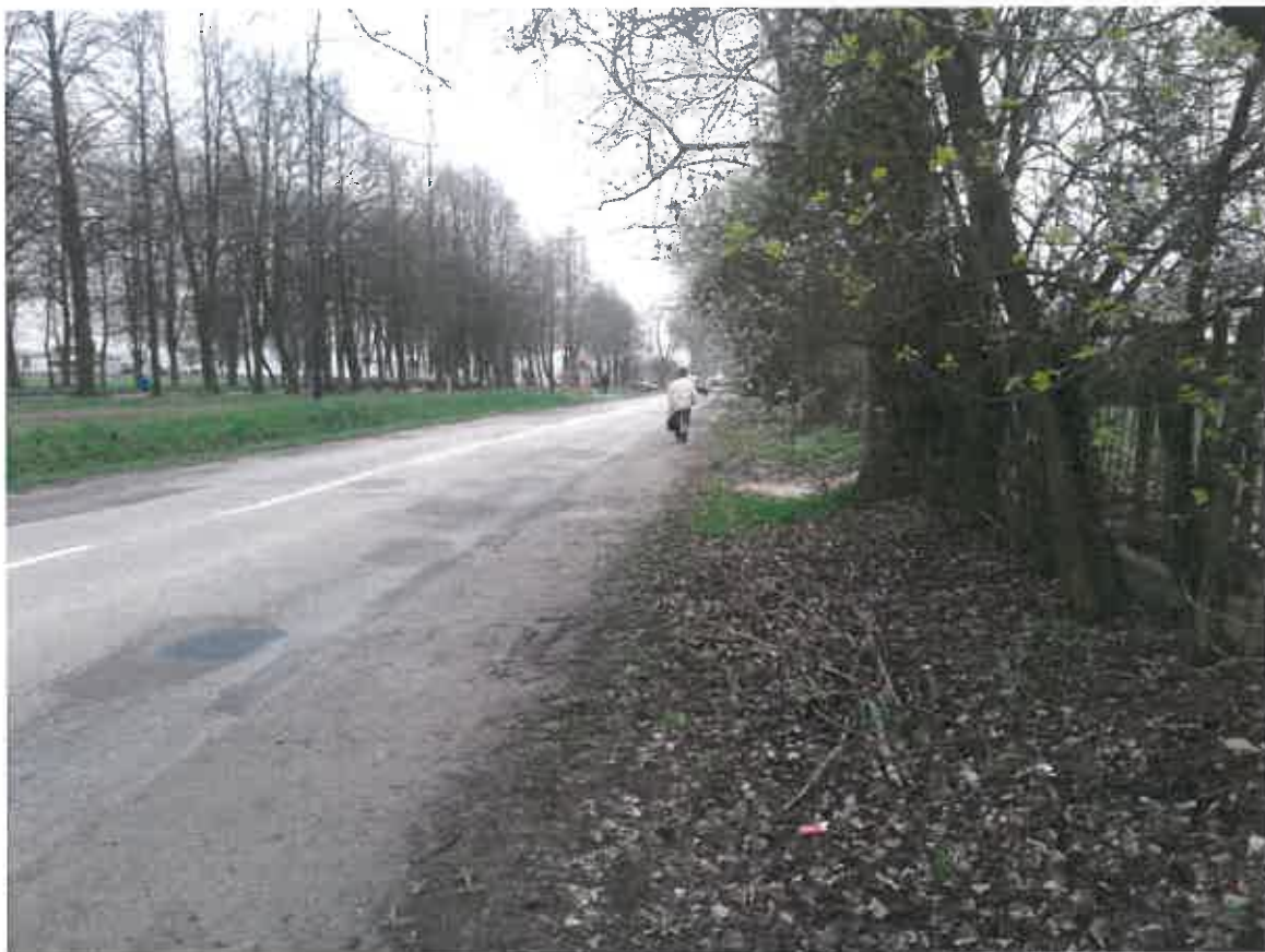
Fot. 2. Dojście do przystanków autobusowych wzdłuż ulicy Krężnickiej.