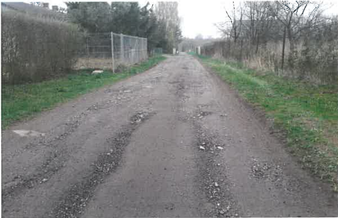
Fot. 1. Ubytki w nawierzchni drogi ulicy Zagajnikowej.