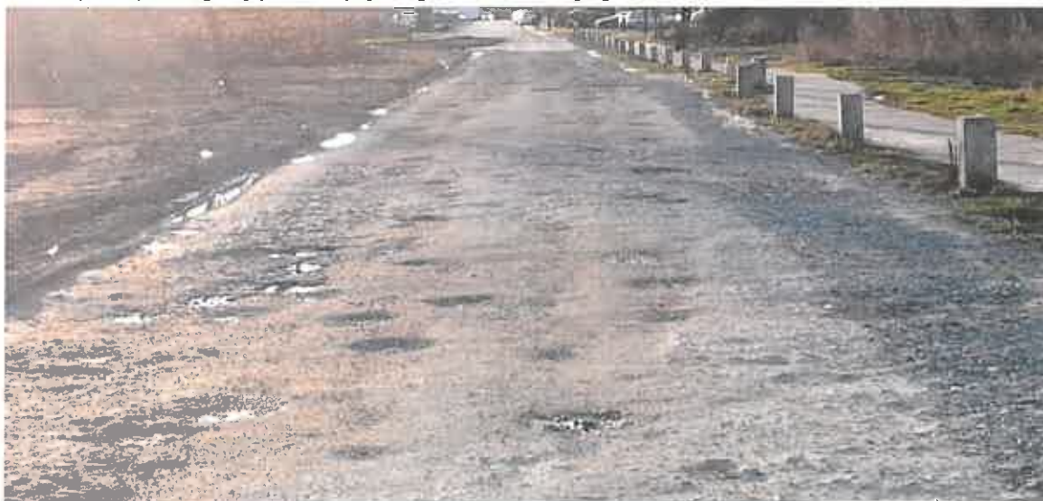
Fot. 1. Ulica Bernarda Wapowskiego (marzec b.r.).

Dziękując mieszkańcom Zielonego Osiedla za udział w spotkaniu 29 października 2015 r., jak również dyrekcji Zarządu Dróg i Mostów w Lublinie za poparcie inicjatywy budowy tymczasowego (jak i docelowego) połączenia ulic J. Samsonowicza i I. Domeyki wnoszę o szybkie podjęcie decyzji w przedmiotowej sprawie.