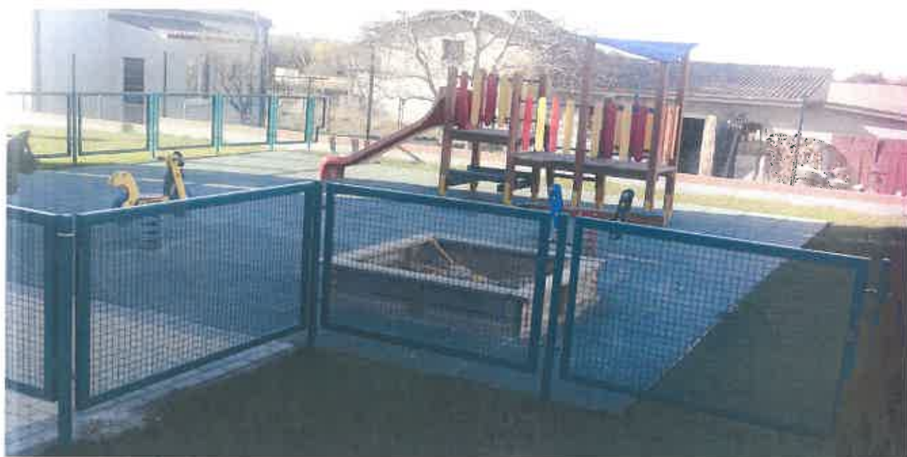
Fot. 1. Plac zabaw przy Przedszkolu Niepublicznym Mały Lingwista II, o powierzchni <85m 2 .