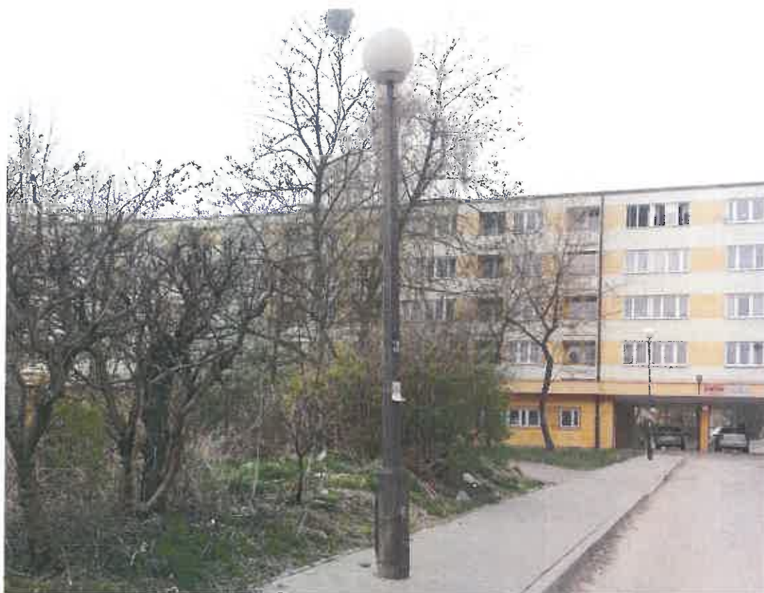
Fot. 3. Latarnie nr 38 i 39 usytuowane na chodniku przy ulicy Kazimierza Dulęby.