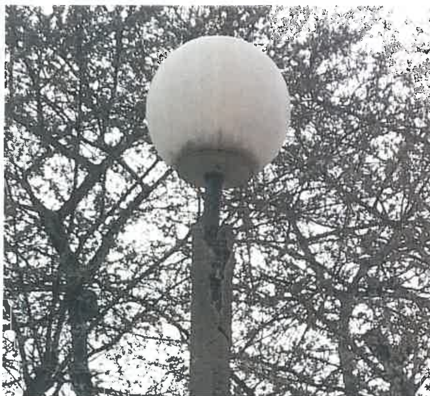
Fot. 4. Zniszczona latarnia nr 40 przy ulicy Kazimierza Dulęby.