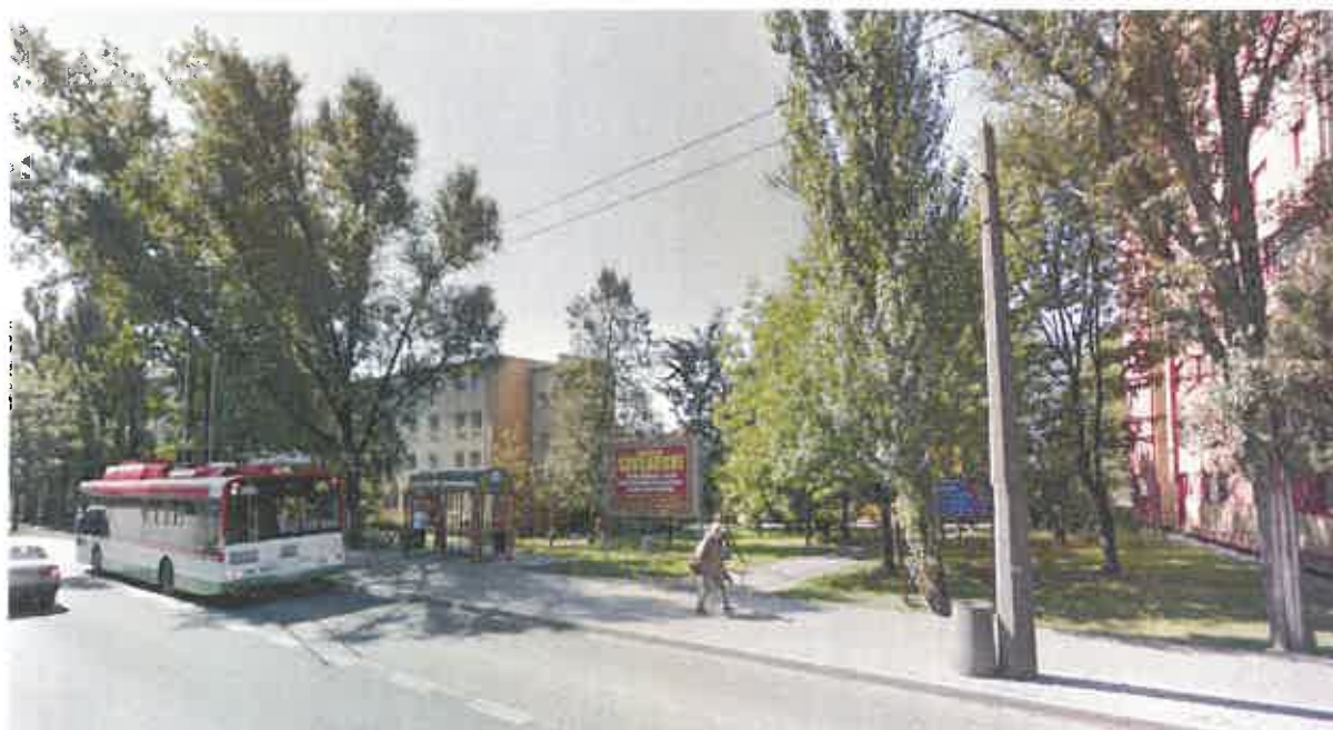
Fot. 5. Brak oświetlenia przystanku autobusowego nr 3131.

Niewątpliwie za niezadowolające można uznać oświetlenie chodnika pomiędzy ulicą Lotniczą a Sulisławicką (południowa strona ul. Droga Męczenników Majdanka), przy czym ciągi te stanowią główne dojście do kościoła parafialnego pw. Św. Maksymiliana Kolbego, supermarketu Stokrotka, supersamu Społem „Jubilat”. Wskazać również należy, że oświetlenie przystanku autobusowego nr 3131 - Dulęby 01 praktycznie nie zostało zrealizowane (fot. 5).