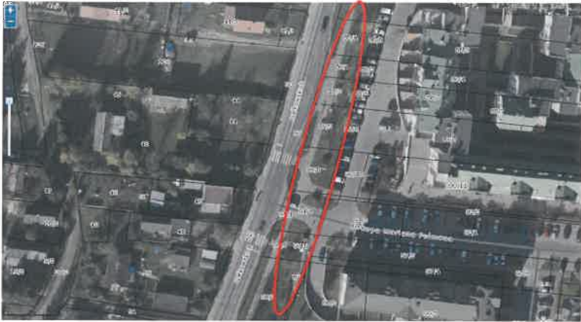
Rys. 1. Proponowana lokalizacja wypożyczalni stacji roweru miejskiego w okolicach Osiedla Słoneczny Dom