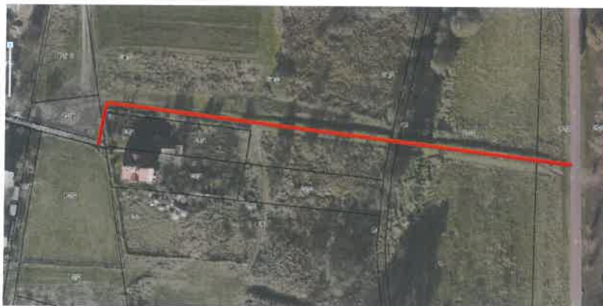
Fot. 2. Ścieżka dla pieszych łącząca ulicę Parczewską i ścieżkę rowerową nad rzeką Bystrzycą.