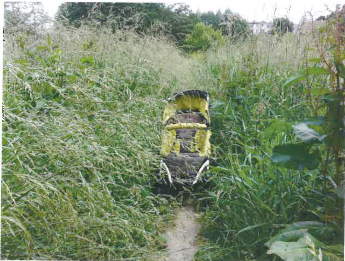
Fot. 1. Zarośnięte przejście na działce nr 94/2, arkusz 14, obręb 43.