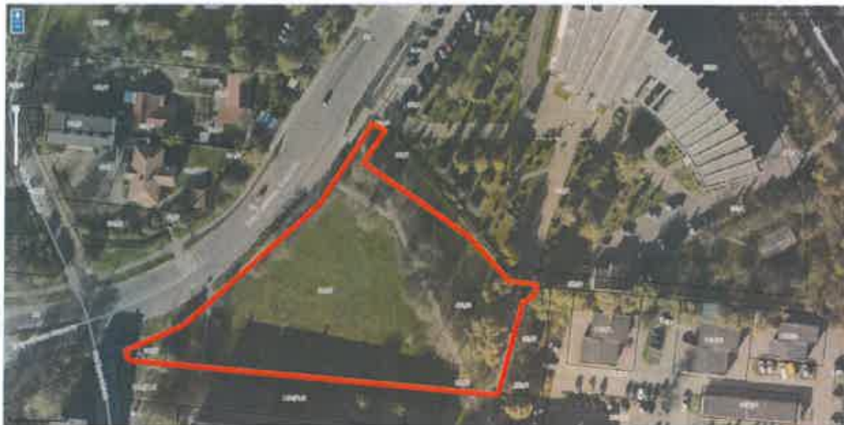
Rys. 1. Lokalizacja działki nr 95/6, arkusz 7, obręb 43.

Z uwagi na powyższe fakty i duże zainteresowanie lokalnej społeczności proszę jak na wstępie tj. o udzielenie szczegółowych informacji związanych z przedmiotowymi postępowaniami.