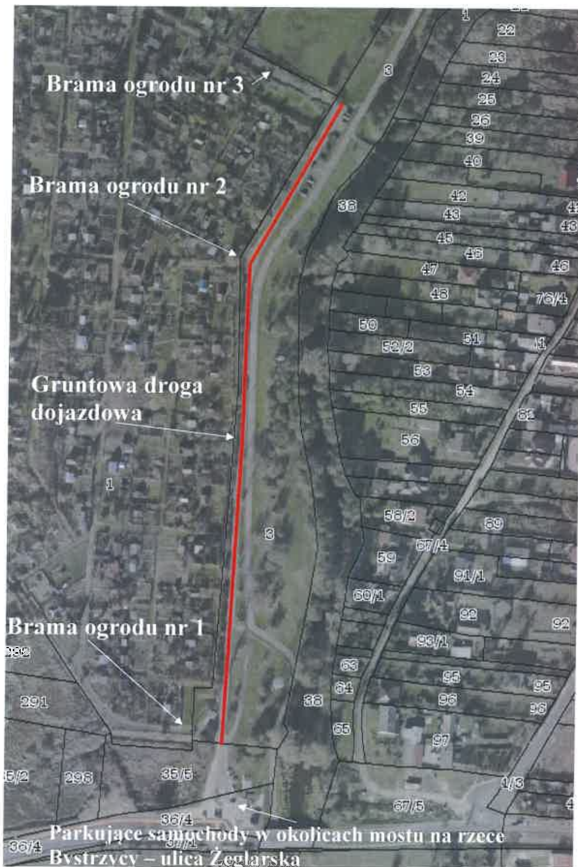
Rys. 1. Droga dojazdowa do bram ogrodu wzdłuż ścieżki rowerowej w dolinie rzeki Bystrzycy