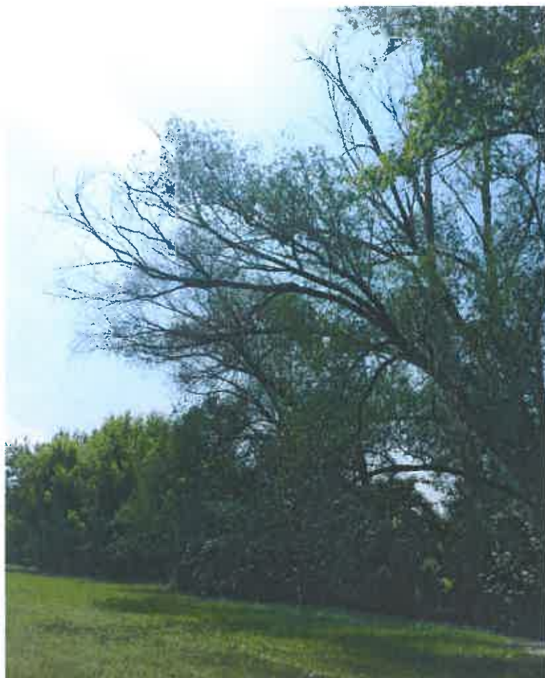
Fot. 1. Obumierające drzewo w dolinie rzeki Bystrzycy w pobliżu osiedla Medalionów.