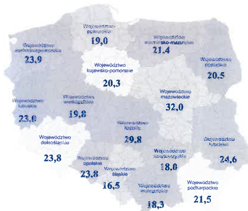
Rys. 1. Występowanie (w proc.) nadmiernej masy ciała (nadwaga i otyłość) u uczniów szkół podstawowych i gimnazjów w różnych województwach http://www.izz.waw.pl/attachments/article/541/INFORMACJA%20PRASOWA%20-%20Oty%C5%82o%C5%9B%C4%87%2022.05.2015.pdf