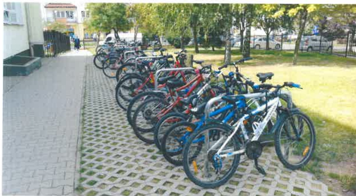
Fot. 1. Oblegane stojaki rowerowe na terenie Szkoły Podstawowej nr 30 im. Króla Kazimierza Wielkiego w Lublinie.

Pokładam głęboką nadzieję, że działania podjęte przez Pana Prezydenta w tej sprawie przyniosą wiele pozytywnych rozwiązań dla naszych dzieci.