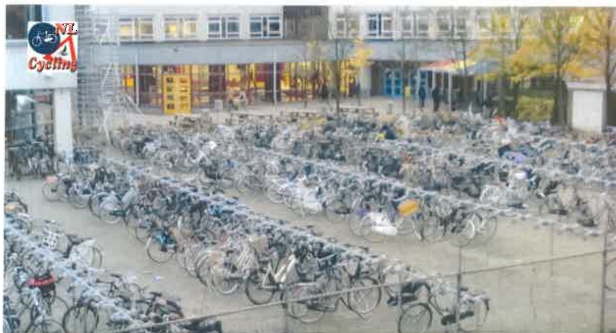
Fot. 2. Parking dla rowerów przy szkole w Holandii https://www.youtube.com/watch?v=8NUgB_xkIvU