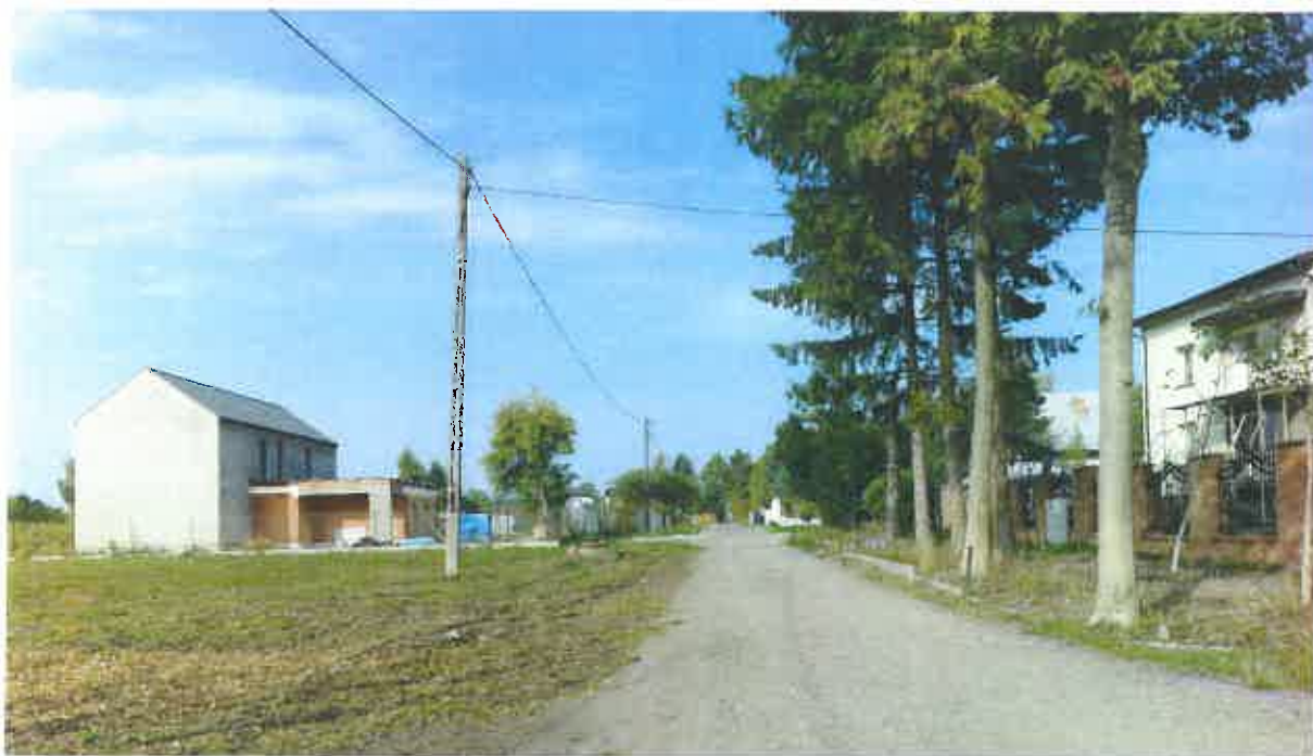
Fot. 1. Słupy elektroenergetyczne wzdłuż ulicy Rąblowskiej.