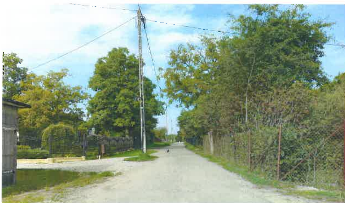
Fot. 2. Słupy elektroenergetyczne wzdłuż ulicy Parczewskiej.