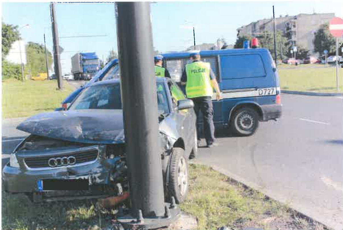
Fot. 1. Wypadek na ulicy Diamentowej w dniu 27.06.2014