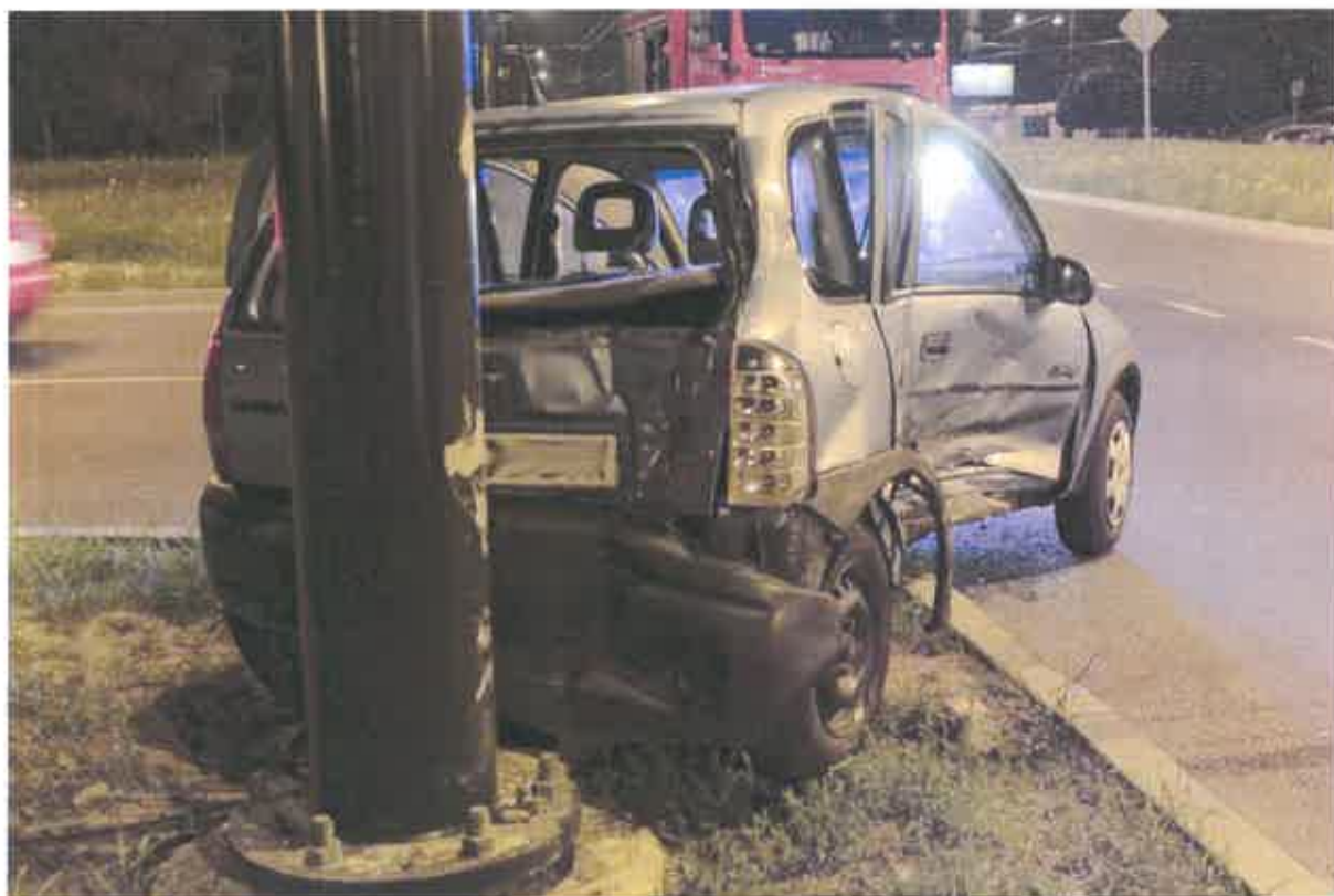
Fot. 4. Wypadek na ulicy Diamentowej w dniu 14.05.2013