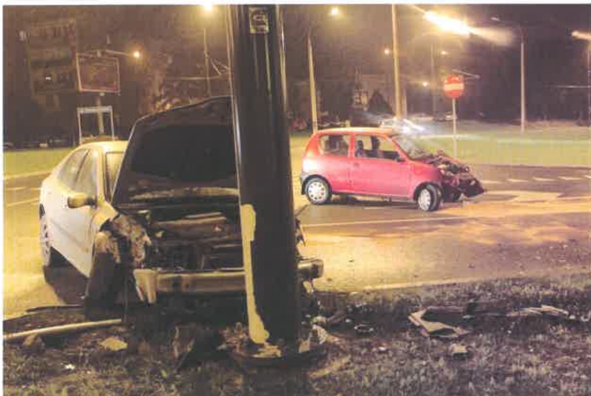
Fot. 2. Wypadek na ulicy Diamentowej w dniu 19.09.2013 ( http://www.lublin112.pl/ul-diamentowa-zderzenie-renault-z-fiatem-jedna-osoba-ranna-wideo-zdjecia/ )