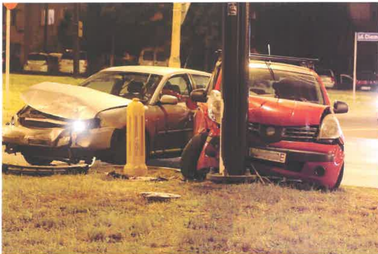
Fot. 3. Wypadek na ulicy Diamentowej w dniu 28.08.2013