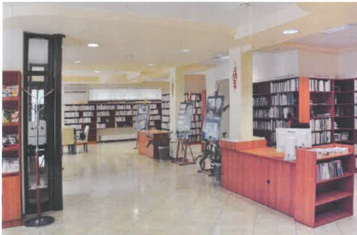
Rys.1. Filia nr 31 Miejskiej Biblioteki Publicznej im. Hieronima Łopacińskiego w Lublinie, ( http://www.mbp.lublin.pl/index.php?option=com_content&task=view&id=50&Itemid=163 )